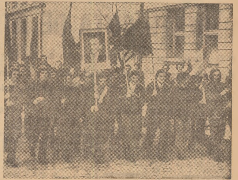
Studentii de la I.E.F.S., purtînd portretul tovarășului NICOLAE CEAUȘESCU, steaguri tricolore și roșii, se îndreaptă spre secția de votare.

O undă de bucurie străbate largă arteră. Locuitorii cartierului, cetățenii ai Capitalei rostesc cu dragoste numele secretarului general al partidului, îi urează din inimă multă fericire și sănătate, ani îndelungați, spre binele și fericirea poporului, spre gloria României socialiste.