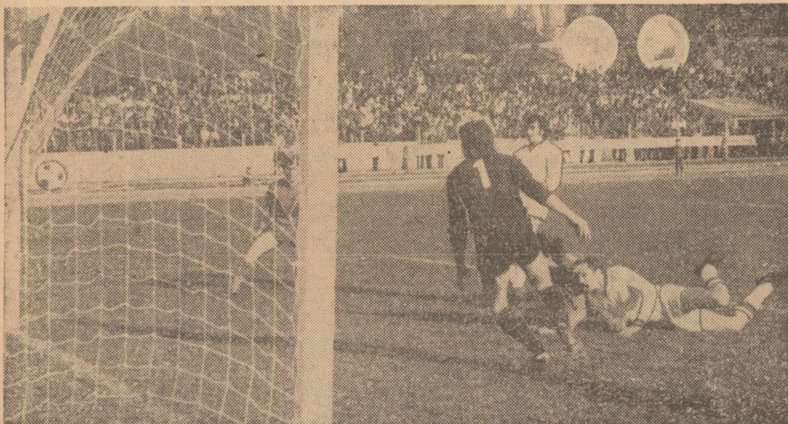
Dudu Georgescu, golgeterul campionatului, a fișnit pe lângă Szöke, înscriind cu capul golul dificilei victorii a liderului

Ce s-a petrecut în acest moment — un pentru fixarea Studenții au răte a întrecerii, balonului, dar multumească cu platonice, a un linia de centru tri a caroului, dincolo se afla să-și joace cu postindu-se bin te culoarele ce tual, s-a ad aproape de bu Pentru că, di jucătorilor de măreanu, Dum evoluat constan au dat echilib cului roș-albas fine, „U” nu un virf de a