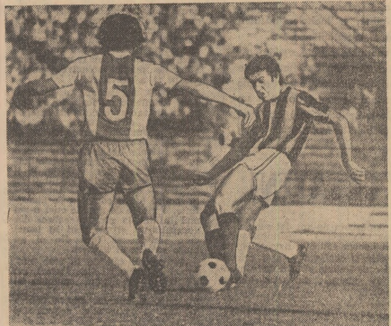
Fază din partida-tur a celor două formații studențești, Universitatea Craiova și Sportul studențesc, încheiată cu victoria bucureștenilor (0-2)