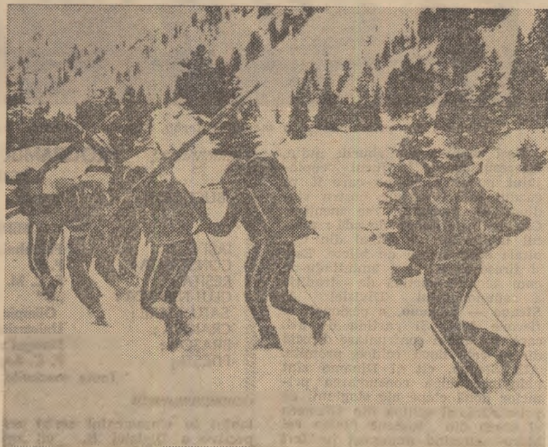
S-a dat startul în raliul creștelor

Rețezatul, această împărăție a alpinistilor, i-a primit pe participanții la etapa de iarnă a alpinadei republicane pentru tineret și fete (3-8 martie) cu un decor strălucit — cer de sticlă, soare fierbinte, masivul încărcat de zăpadă. Tabăra competiției a fost instalată la Cabana Pietrele, de unde cei peste 120 de sportivi — cea mai mare participare de până acum — au luat cu asalt creștele. 20 de echipe de băieți și 8 echipe de fete, din 15 asociații s-au prezentat la start. Concursul a constat din escaladarea unor pereți, pe trasee de gradul II și III, gradație de iarnă, o probă de schi, coborâre pe teren variat și un spectaculos raliu al creștelor. În cadrul acestui raliu, care a atins, printre altele, virfurile Rețezat, Vl. Mare, Păpușa, a intrat și o noapte petre-