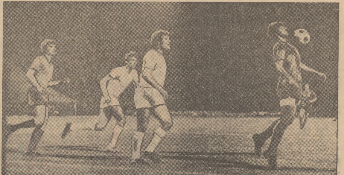
Moment din prima manșă a meciului derby, Steaua—Dinamo, disputat în turul campionatului