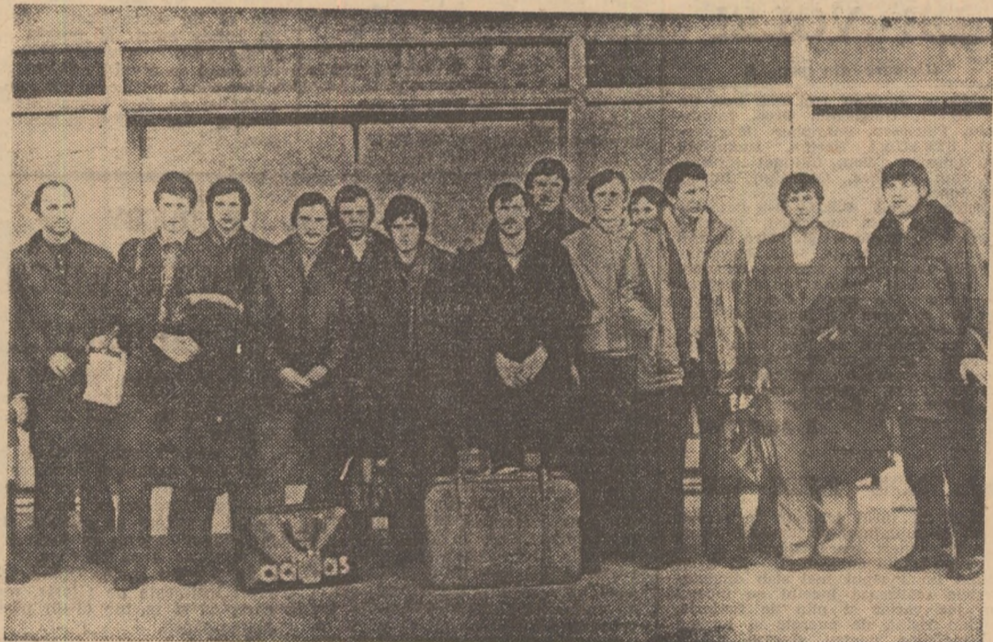
Lotul juniorilor sovietici, la cîteva minute după aterizarea pe aeroportul internațional Otopeni