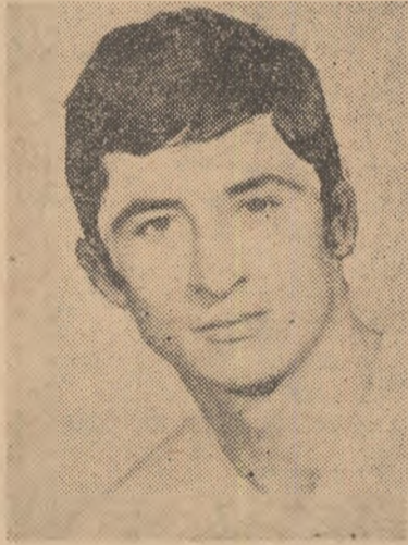
Dinu (căpitanul echipei naționale) și Dumitru, doi dintre pilonii „tricolorilor” de ieri și de azi

● Astă-seară, la ora 18, pe stadionul „23 August”, meci de verificare Lotul A — Progresul ● Programul complet al lotului A pînă la plecarea la Praga ● Componenții selecționatelor de tineret au declanșat și ei pregătirile pentru întîlnirile de duminică