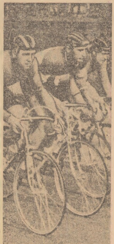
Aspect din timpul cursei pe circuit. În fruntea cursei (primul din stînga) Ilie Valentin