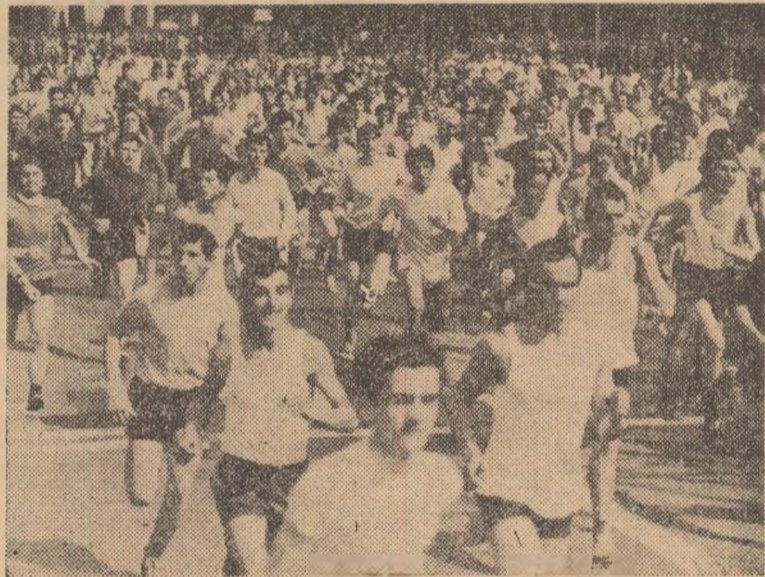
Crosul — mijloc la îndemina oricui pentru a-și fortifica organismul — a reintrat, indiscutabil, în drepturile sale. Acest instantaneu este un argument elocvent.