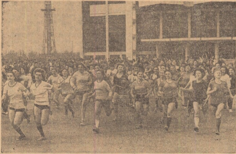
Start în „Crosul Primăverii”