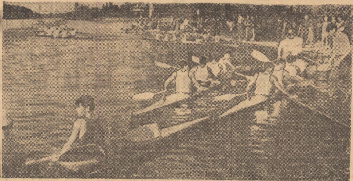
Ca în fiecare primăvară, animațiile pe lacul Snagov, dar și pe malurile lui...

De câteva zile, pe apele Snagovului au reapărut ambarcațiunile de „aur” ale caiaștilor și canoaiștilor! Așadar, după intensele pregătiri de iarnă, fragmentate în câteva etape importante (București, Predeal, din nou București, Orșova), campionii padelei și pagael s-au reîntors la „școala Snagovului”. Se continuă, de fapt, greaua cursă a pregătirilor pentru marile obiective ale acestui an (campionatele mondiale de seniori, Belgrad 31 iulie—3 august, și campionatele europene de juniori, Roma 25—27 iulie) și, firește, pentru Montreal '76. O muncă anonimă, dar hotărâtoare pentru sezonul competițional, de care nu se desparte prea mult timp. Tocmai de aceea ni se pare oportună o agendă a noutăților din acest sport cu tot mai largă răspândire și, după cum se știe, de anul trecut cu o crescută pondere în programul olimpic.