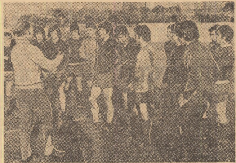
Moment de la un antrenament al lotului spaniol: Kubala și elevii lui...

3. Fotbalistii noștri au început să suporte eforturile unui regim de jocuri duminică — miercuri — duminică. Tocmai în acest sens, s-a înțeles, în perioada pregătirii centralizate de la Snogov, disputarea a două jocuri-scoală, într-un interval scurt. Ele ar trebui angajate pe fondul unor antrenamente de intensitate, pentru conservarea pregătirii fizice, dublate de altele, cu conținut tactic, pentru exersarea ideii de joc.