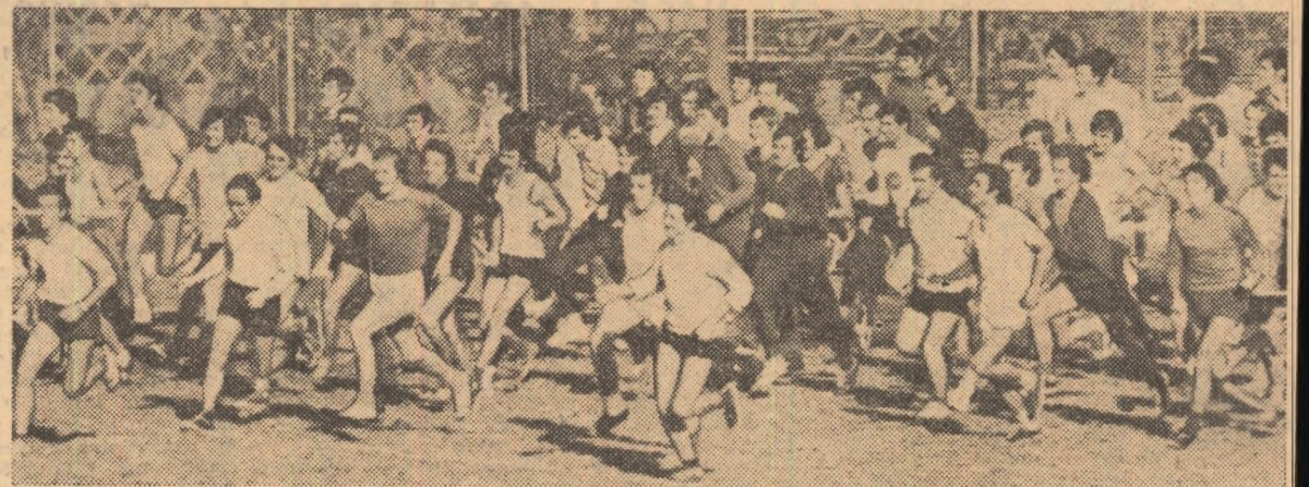
Imagine surprinsă în timpul desfășurării unei întreceri de cros în parcul I.O.R. din Capitală