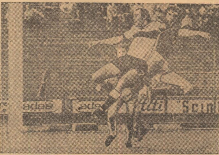
Leșeanu a câștigat duelul aerian cu Păltinisan, dar mingea expedită cu capul, va greși de puțin ținta. Fază din meciul Sportul studențesc — „Poli” Timișoara, disputat în etapa trecută

Etapa a XXIII-a, a șasea din acest sezon, marchează pe planul desfășurării întrecerii în ansamblu, trecerea în cea de-a doua treime a returului, iar din punct de vedere al mizei, transferul interesului către partea inferioară a clasamentului, acolo unde nu mai puțin de șapte echipe, de la locul 10 la 16, se înșiră pe distanța a două puncte!