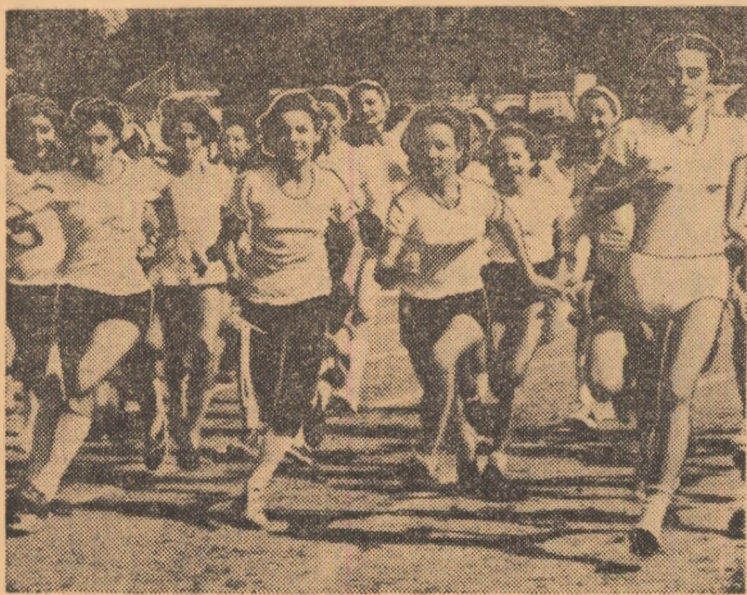
Start în proba de rezistență, fete, categ. pînă la 14 ani

Se poate, deci, afirma că acțiunea de duminică — la care au fost mobilizați aproape 2 000 de tineri — a marcat, de fapt, pentru unii obținerea brevetelor, întrucît și-au trecut toate normele, iar pentru alții, debutul. Reprezentanții ai școlilor generale 1, 2, 3 și 4, ai liceului teoretic, ai aso-