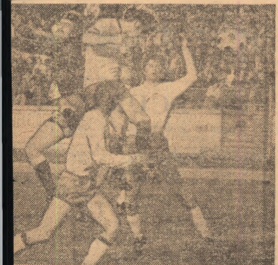
Un gol al echipei noastre. Si, totuși, nu va fi un

— cum este la Dessau — mei de la Co- blema selec- ret, sunt toată a toată acui- — ajutat la a. Vasilescu I arcele forma- urima, Sma- scuță — Mul-