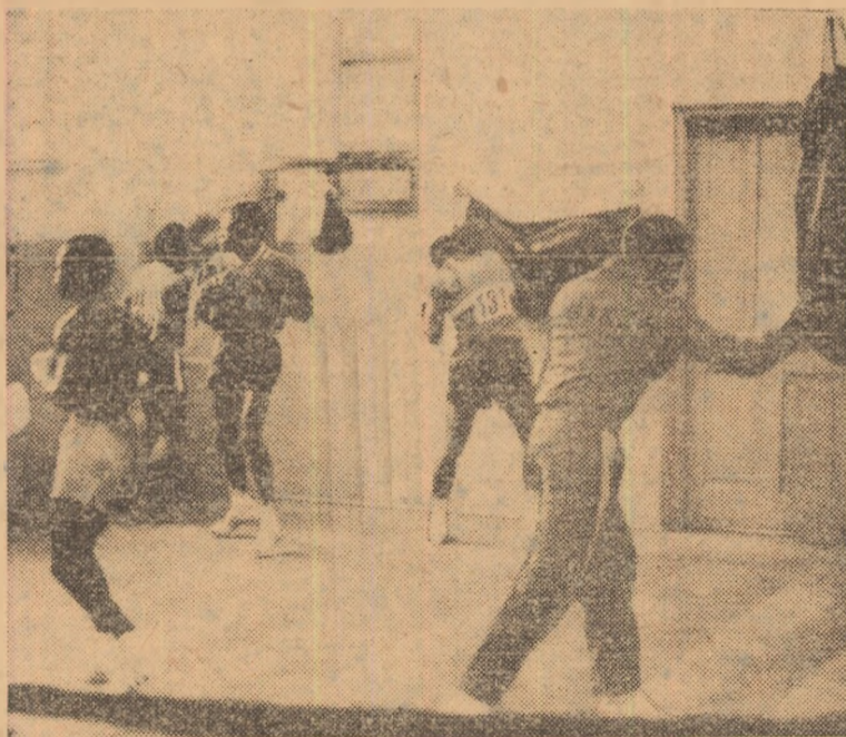
În sala „Metalul”, boxerii străini, participanți la „Centura de aur”, efectuează ultimele antrenamente.