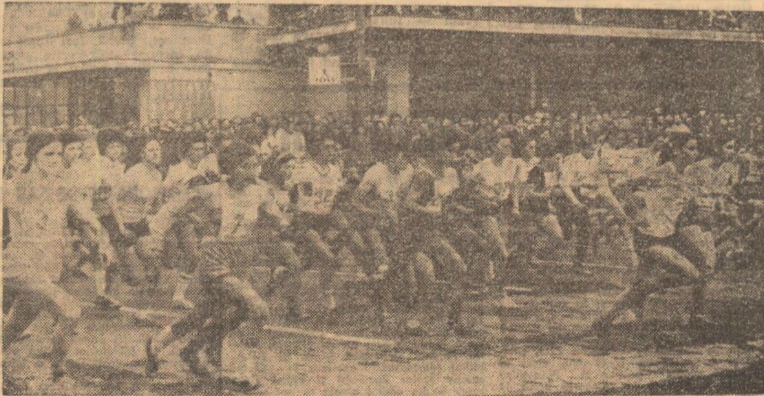
Start în finală pe 300 m (fete, 15-16 ani) din cadrul „Crosului tineretului”

Tradiționalul Festival național de minibaschet, ajuns la ediția a IX-a, se va desfășura la Constanța, între 16 și 20 iunie. Comisia de organizare a acestei frumoase manifestații sportive, care s-a bucurat întotdeauna de un mare succes, conținează pe participarea a circa 1000 de minibaschetbaliști din aproape toate județele țării. Precizăm că Festivalul va consta în întrecerea propriu-zisă între micii sportivi (împărțiți în două categorii de vîrstă: născuți în 1962 și mai tineri, născuți în 1964 și mai tineri), precum și în concursuri de desen, poezie, pictură, cor, precizie la aruncările la coș și talie.