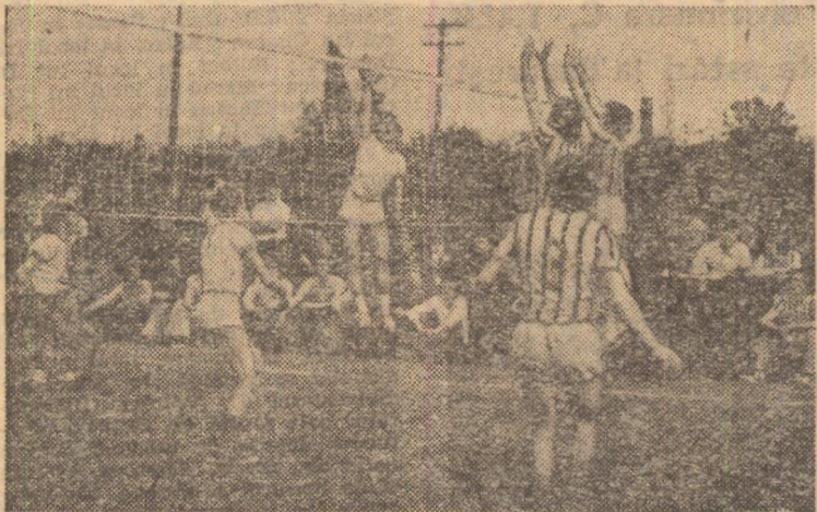
Secvență din turneul final al echipelor de volei, câștigat de reprezentanții Institutului Agronomic din Timișoara.