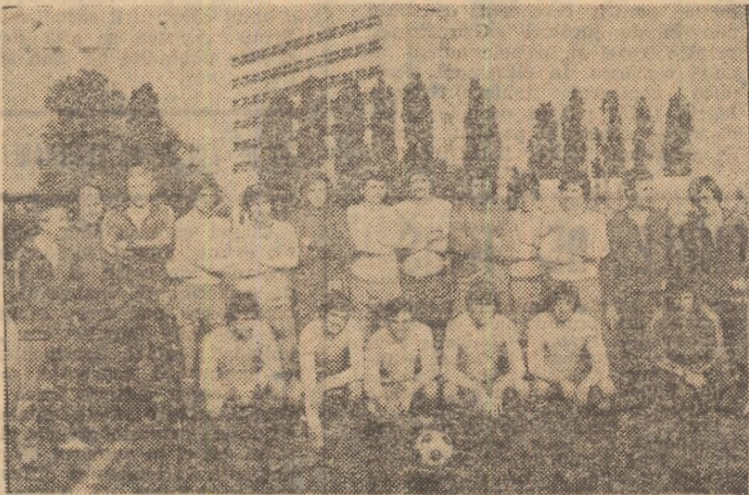
Lotul nostru de tineret (23 ani), care întîlnește mine, la Holbaek, reprezentativa Danemarcei, în cadrul Campionatului european.

în echipa Holbaek activează doi dintre probabili adversari ai echipei noastre, în întîlnirea de sîmbătă (e vorba de Niels și Allan). După finele acestui meci, băieții noștri vor rămîne în incinta stadionului pentru a efectua un antrenament cu durata de o oră. Antrenorii Drăgușin și Nunweiler ne-au comunicat că este prematur să se pronunțe asupra formației, cu atît mai mult cu cît după accidentarea lui Lucăș, titularul postului de fundaș stînga se află sub un semn de întrebare, el ur-