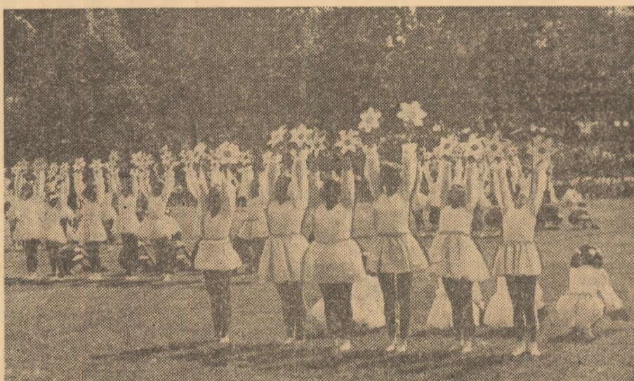
In cadrul activităților sportive școlare, exercițiile de gimnastică sînt mult îndrăgite, mai cu seamă de elevi. Este grăitor acest instantaneu, surprins în timpul unei reprezentări la Tg. Jiu, cu prilejul închiderii anului de învățămînt.

lități în a oferi tinerilor condiții să practice sporturile preferate, s-a înscris, în ultimul timp — ca de altfel și celelalte județe ale țării — pe o linie ascendentă în activitatea sportivă de masă. O recentă vizită în acest județ ne-a prilejuit unele însemnări despre viața asociațiilor sportive din întreprinderi și instituții, din școli și de la sate, pe care le redăm în această pagină.