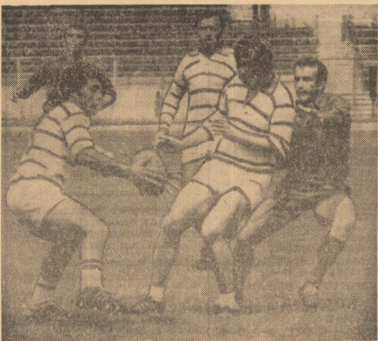
Foarte atenși în întreg meciul cu Steaua, rugbiștii dinamoviști sînt și de această dată în avantaj numeric... (amănunte despre meciurile din campionatul de rugby în pag. 2-3)