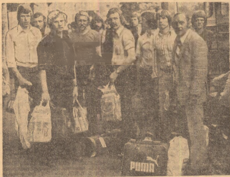
Fotbaliștii danezi, la puține minute de la sosirea lor în Capitală.

Aseară a sosit în Capitală lotul fotbalistilor danezi, care va susține mâine, pe stadionul „23 August”, prima manșă din dubla întâlnire cu echipa noastră din cadrul preliminariilor turneului olimpic. Este un lot mult modificat, față de cel deplasat cu trei săptămîni în urmă la București, cînd fotbalistii danezi au fost învinși categoric de „tricolorii” noștri în Campionatul european.