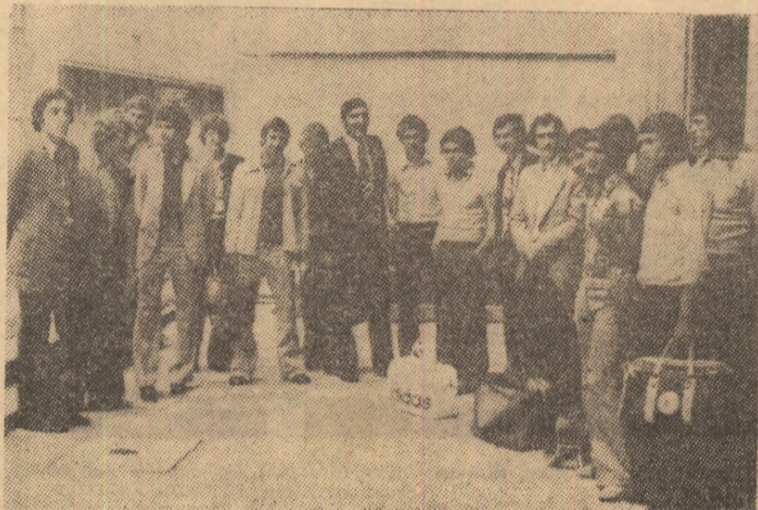
„Tricolorii” s-au reunit ieri dimineață pentru ultima partidă a sezonului de primăvară