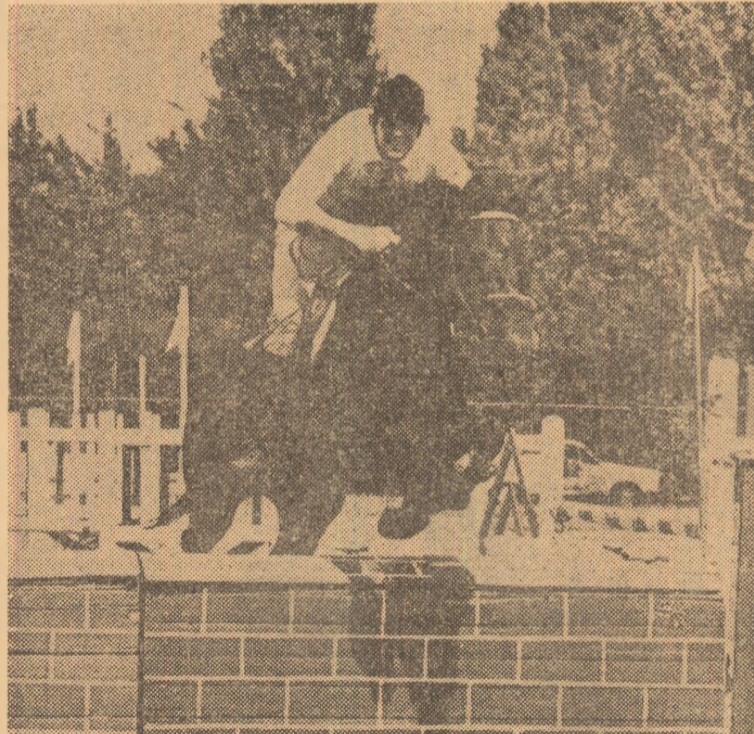
Rinaldo Durante (Italia), autorul unuia din cele mai bune rezultate

Așadar, întâlnirea bucureștenilor cu gimnastica, cu citiva dintre cei mai autorizați reprezentanți de valoare mondială, astăzi după-amiază, de la ora 18, la sala Floreasca (și pe micul ecran în transmisie directă). Biletele pentru această demonstrație se găsesc la casa sălii.