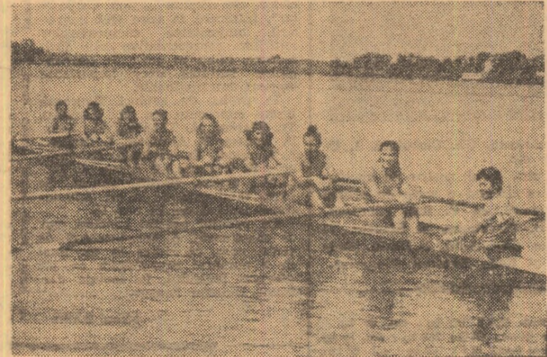
Tinerele canotoare din echipajul de schif 8+1 al României aspiră la un loc pe podium în „Regata Snagov“.

două ediție a Regatei Internaționale feminine — Snagov. La această importantă reuniune nautică, care debutează după-amiază cu seria eliminătorii, își vor disputa înticetatea echipajele din Cehoslovacia, Bulgaria, Polonia, R.D. Germană, U.R.S.S., Ungaria și România, multe dintre ele medaliat la C.M.