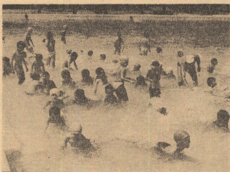
Moment de relaxare după terminarea unei lecții...