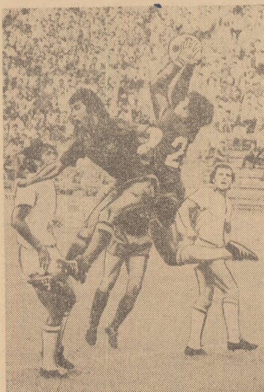
Un nou atac al Stelei se irosește în duelul cu defensivă arădeană.