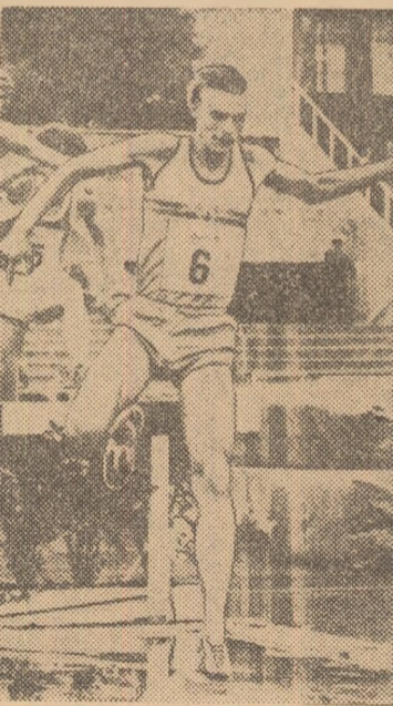
Suedezul Anders Gaerderud, în timpul cursei de 3000 m obstacole de la Oslo, care i-a adus recordul mondial (8:10,4).

„CUPA DE VARĂ“ — ediția 1975 a fost inaugurată la Stockholm cu partida dintre echipa locală AIK și formația Polonia Bytom. Fotbaliștii polonezi au terminat învingători cu scorul de 2-0 (0-0).