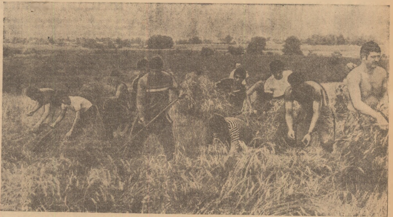
„Nici un spic de grâu nu trebuie pierdut” — iată gîndul care i-a animat pe sportivii prezenți pe lanurile de lângă satul Siliștea Snagovului