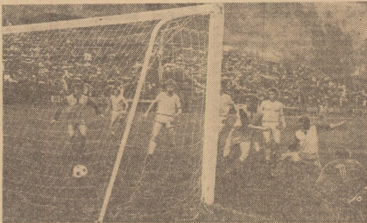
Zece jucători în preajma porții lui Baihoși I care nu poate opri înscriserea golului. Fază din meciul F.C.M. Reșița — Olimpia Satu Mare, disputat în retur.

Acestea sint, în linii mari, echipele care își datorează comportările bune, în ansamblu, și pregătirii fizice (efectuată mai metodic, mai consistent și, oricum, mai judicios dozată pe parcursul competiției), fapt remarcabil, de altfel, în repetate ocazii, și de către conducerea tehnică a echipei noastre naționale, satisfăcută de potențialul de efort cu care s-au prezentat jucătorii selecționabili la reuniunile lotului reprezentativ.