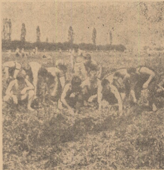
Sportivi din loturile republicane de judo și haltere, aflați în vacanță la Brașov, au cerut să participe la strîngerea recoltei din județul Brașov. Iată-i la plivitul speciei de zahăr și cîrnatul cepei.