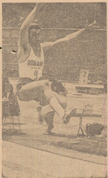
Vasile Bogdan — recordmanul țării la decathlon

Sîmbătă și duminică stadionul din Poiana Brașov va găzdui întrecerile uneia dintre semifinalele Cupei Europei pe echipe la decathlon și la pentathlon. Celelalte două semifinale ale competiției poliatloniștilor europeni se vor desfășura la Banská Bystrica (Cehoslovacia) și la Barcelona (Spania),