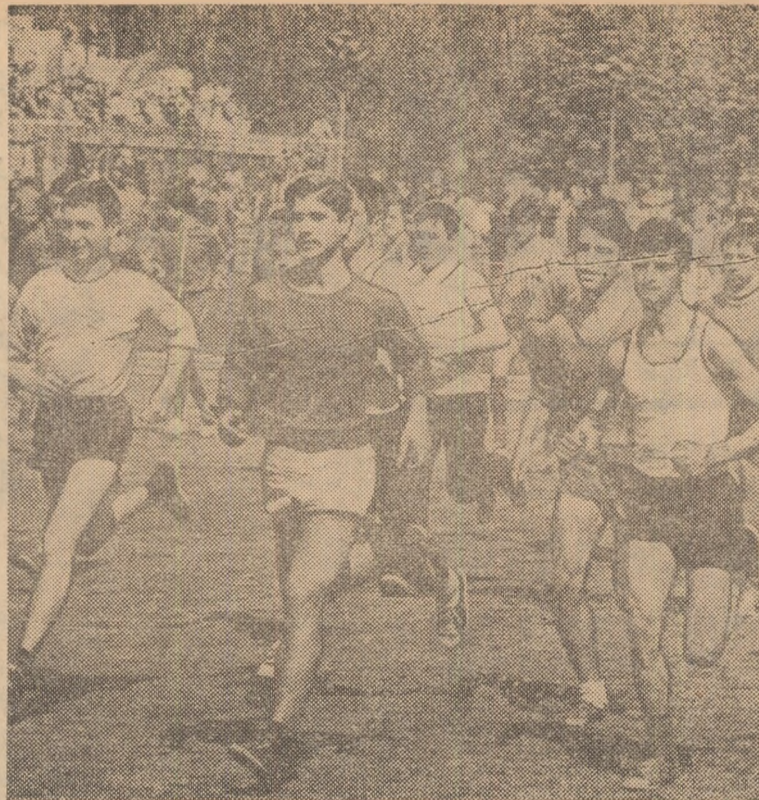
Odată cu începerea noului an școlar revin în actualitate întrecerile sportive. Printre cele mai populare discipline se află crosul. Instantaneu într-un parc din Capitală.