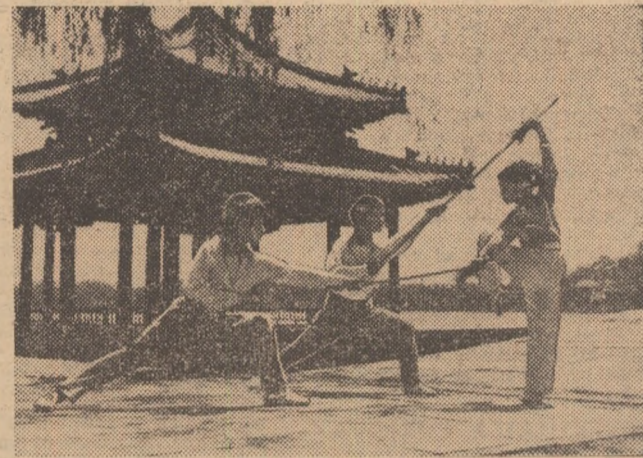
Doi adversari cu lănci împotriva unei singure adversare — exercițiu de „Wu Shu” care cere o înaltă măiestrie.