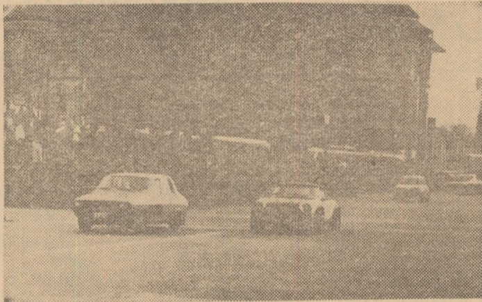
Aspect din timpul desfășurării cursei auto la clasa peste 1300 cmc