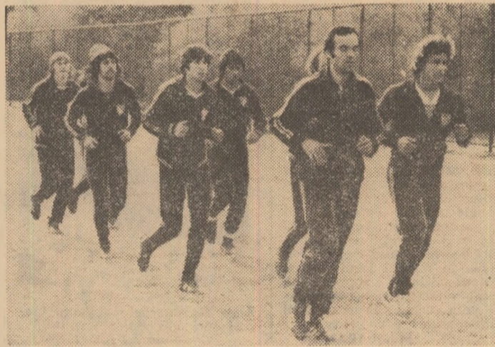
Îată-i pe fotbalistii turci în timpul ședinței de antrenament de ieri duminică.