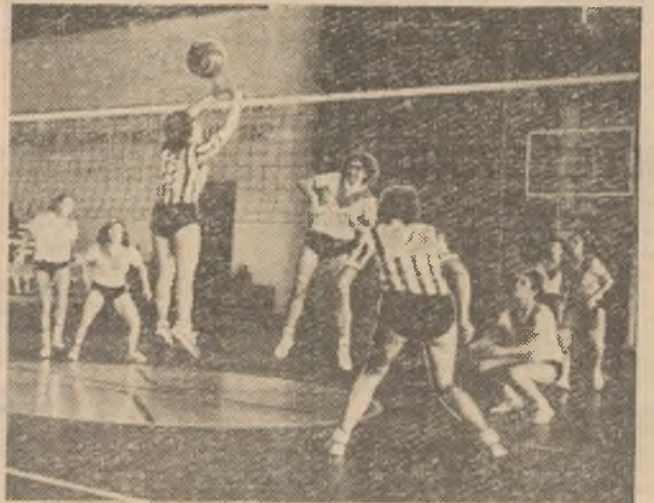
Studențe ale Universității din Tirana, într-o întîlnire de volei, disputată într-una din sălile de sport ale capitalei R. P. Albania.

Puterea populară a pus la dispoziția tineretului albanez largi mijloace pentru practicarea sportului. Pretutindeni, chiar și în cele mai îndepărtate localități din mediul rural, au fost construite baze sportive, stadioane și terenuri de sport. În pitoreștile stațiuni de odihnă, la munte și pe litoralul mării, tinerii iau parte la excursii, practică natația, alpinismul și turismul.