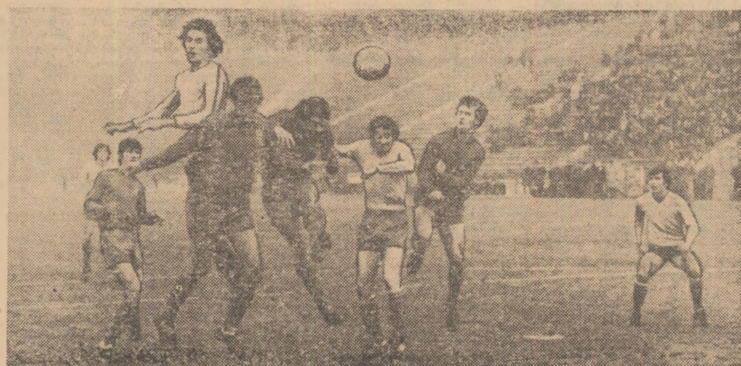
Atac al lotului A la poarta echipei de tineret-speranțe Steaua. (Aspect din jocul de antrenament de ieri al „tricolorilor”).