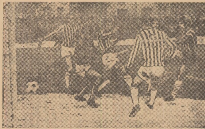
Dumitriu II (în tricou de culoare închisă) a sutat, dar balonul va ocoli poarta Chimiei. (Fază din meciul Progresul București — Chimia Rm. Vilcea 1-1).

DINAMO SLATINA — TRACTORUL BRAȘOV 1-1 (1-1). Au înscris: Gămbău (min. 39, din 11 m) pentru Di-