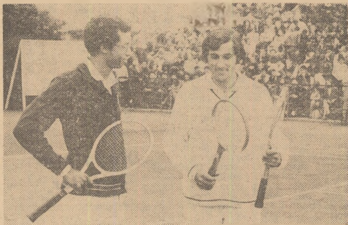
Filă de album: Arthur Ashe înaintea partidei amicale cu Ilie Năstase, la București, în mai 1970.

Iar ultimul cuvînt a aparținut, cum știm prea bine, lui Ilie Năstase, care — cîștigînd în mod strălucit turneul Masters — reface la finis un handicap acumulat pe aproape întreg sezonul și promovează în eșalonul de vîrf. Prezența remarcabilă și prin faptul că este al șaselea an conse-