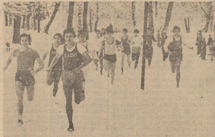
Instantaneu din cadrul crosului dotat cu „Cupa 30 Decembrie“, la Sibiu, în parcul „Sub arini“.