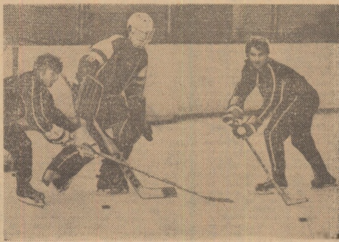
La antrenamentul de ieri după-amiază al echipei Ungariei

Competiția internațională de hochei pentru juniori, „Turneul celor 6 națiuni“, începe astăzi pe patinoarele artificiale din București și Ploiești.