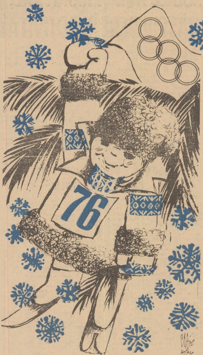
Desen de N. CLAUDIU