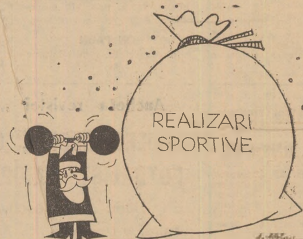
Trebuie să mă antrenez ! Cum duc sacul ăsta ? Desen de Adrian DRAGOMIRESCU

PRISTANDA : N-avem echipă puternică ? Păi să le numărăm. Alea două din frunte. 2... Apoi Steaua și Dinamo. 5... Pe urmă cei din Ghencea și din Ștefan cel Mare. 8... Mai sînt formațiile lui Jenei și Nicușor. 13... Una-două să le fi uitat. Dar sînt exact 18 !