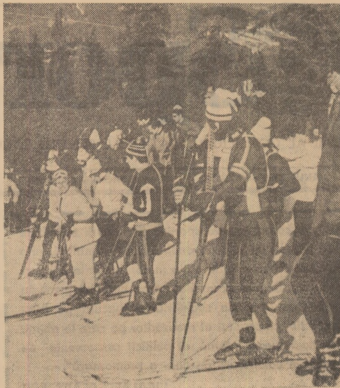
Sporturile de iarnă, schiul mai ales, dar tot mai mult și patinajul, sîniușul sau hocheiul pe gheață, au cîștigat în acest an o largă audiență în rîndurile tineretului.

Despre câteva din realizările pe care le-am avut în vedere, în această pagină-bilanț.