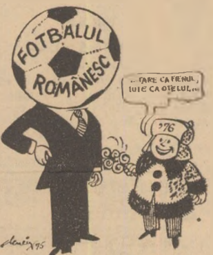
Aurită să-ți fie gura ! Desen de Al. CLENCIU

La proverbe cînd recurge, Jiul are drept să zică : — Nu e rău. Dacă nu curge, Pică !