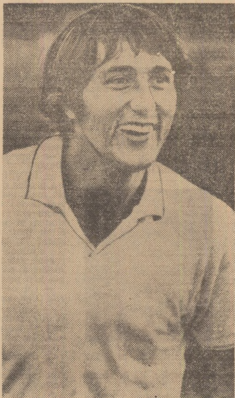
RADU BELIGAN artist al poporului

Într-o cronică dramatică la spectacolul „Jocul de-a vacanța“, Radu Popescu imi făcea cîntec să pună în aceeași termeni jocul meu pe scenă cu jocul lui Ilie Năstase pe terenul de tenis. Nu știu dacă această comparație îl onorează pe Ilie Năstase dar, pentru mine, unul, ea constituie un titlu de mîndrie, fiindcă fac parte dintre cei care apreciază cutezătoarele, inspiratele și atît de bine țintite replici ale acestui uimitor talent. Fi-rește, profesiunile noastre cer fiecărui alt gen de relații cu spectatorii; bineînțeles, sîntem și temperamente foarte deosebite, dar — nu numai o dată — amîndoi am fost angajați în partide imposibile și cu arbitri aplicînd arbitrar regulile jocului. Oricum, dacă Ilie Năstase nu are întotdeauna darul de a ști să piardă, el îl are pe acela, mai prețios, de a ști să cîștige, de a nu ceda, de a lupta superb pentru victorie. Ultima lui performanță de la Stockholm m-a emoționat ca un mare spectacol.