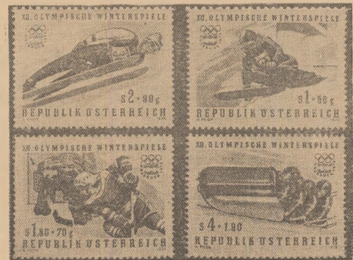
Iată prima emisiune de patru timbre dintr-o serie filatelică foarte frumoasă, editată de poșta austriacă în cinstea J.O. de iarnă

Cehoslovacia — Bulgaria, R. F. Germania — Elveția; 3 FEBRUARIE: Finlanda — Japonia, S.U.A. — Iugoslavia, U.R.S.S. — Austria. Invingătoarele vor evolua în grupa A, iar învinsele în grupa B.