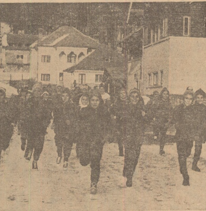
Înainte de masă, o scurtă alergare în jurul Căminului alpin din Bușteni. O inițiativă de la care nu absentează nimeni!

Cîteva acțiuni deosebit de interesante cu caracter sportiv punctează vacanța de iarnă pionierească. Una s-a și încheiat, cea de la Miercurea Ciuc, prilejuită de desfășurarea „Cupei 30 Decembrie“ la hochei pe gheață și patinaj. Urmează, în partea a doua a vacanței de iarnă, finala „Cupei speranțe-