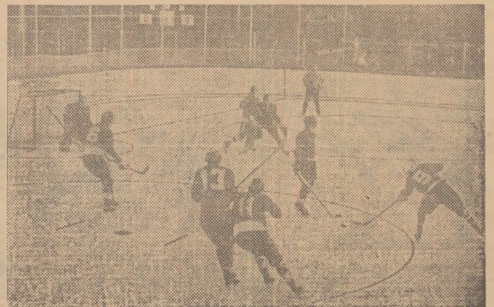
Fază din meciul Bulgaria — Italia, care a inaugurat activitatea competițională pe patinoarul artificial din Ploiești. Jocul a furnizat o confruntare echilibrată