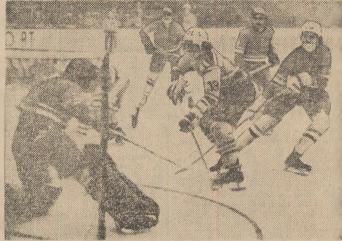
Gheorghiu (nr. 13) a depășit întreaga apărare adversă și va ridica la 7-1 scorul meciului de simbătă

Ajunși spre finalul pregătirilor pentru marile întreceri ale actualului sezon (participarea la