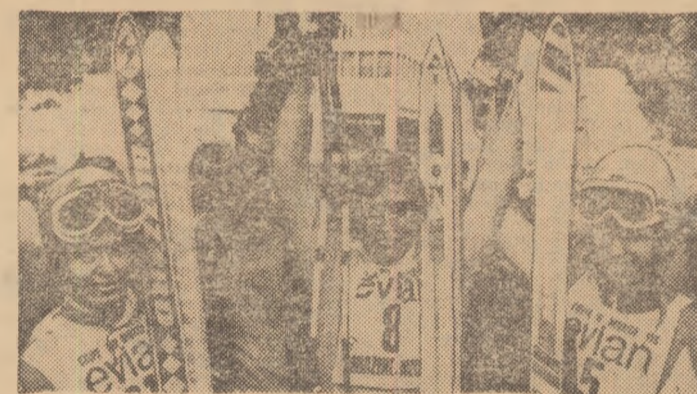
După proba de coborire de la Morzine-Avoriaz, contind pentru Cupa mondială, laureații (de la stînga la dreapta): tinărul din grupa secundă valorică Anton Steiner (Austria) — locul 3, Franz Klammer (Austria) — locul 1 și Bernhard Russi (Elveția) — locul 2.

VARȘOVIA, 19 (Agerpres). Turneul de baschet desfășurat la Lublin (Polonia), s-a încheiat cu victoria formației Slask Wrocław. Pe locurile următoare, cu cite o victorie, s-au clasat echipele Steaua București, Lublinianka și Start. Coșgăterul competiției: Gheorghe Oczelak cu 66 de puncte. Ultimele rezultate: Slask — Steaua 75 — 71 (50-40); Start — Lublinianka 68-64 (38-38).