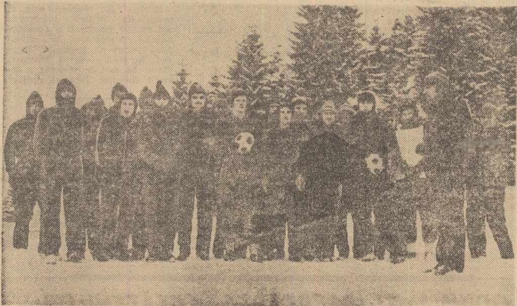
Înainte de un cros de circa 6 km, grupul jucătorilor de la Steaua și antrenorul lor, Emerich Jenei, pozează obiectivului fotografic.

Un grup de sportivi — fără prim-planuri — așa cum îi înfățișează și fotografia alăturată reportajului nostru. Doar cele două mingi le spun, oarecum, ocazionalilor trecători prin dreptul Telefericului din Poiana Brașov că acești oameni în treninguri albastre sunt fotbaliști, oaspeți matinali, pentru circa o oră și jumătate, ai frumoasei stațiuni de iarnă de la poalele Postăvarului.