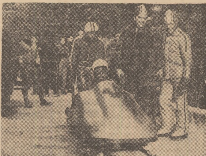
Multiplul campion mondial și olimpic Eugenio Monti (primul din dreapta) în mijlocul boberilor români aflați la antrenamentele cronometrate pe noua pirtie din Sinaia

— Credeți că rolul împingătorilor a devenit atît de important pe cît afirmă unii specialiști?