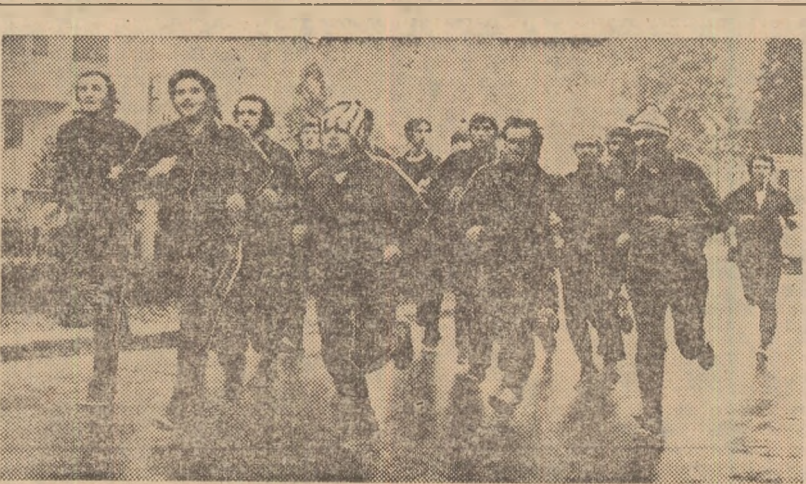
Printre echipele de fotbal prezente în aceste zile în stațiunea Băile Herculane, în vederea efectuării unei bune pregătiri fizice generale, se numără și C.F.R. Timișoara (din Divizia B). În cliseul alăturat vă prezentăm o secvență de la unul din antrenamentele efectuate de jucătorii acestei echipe pe Valea Cerneli.