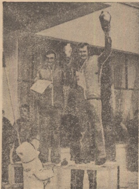
Moment din timpul festivității de premiere.