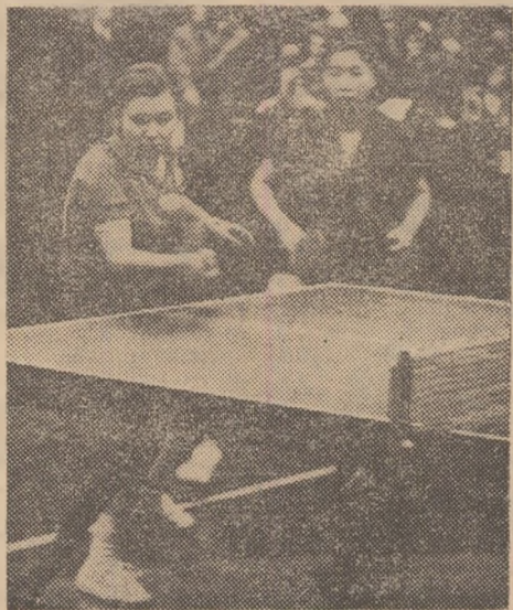
Campioanele la dublu femei

Un public numeros și entuziast, bun prieten și cunosător al tenisului de masă, a asistat sâmbătă și duminică la desfășurarea Campionatelor internaționale ale României. El a putut urmări frumoasa evoluție a unei bune părți dintre numeroșii participanți, unii cu o deosebită reputație în lumea tenisului de masă. S-au întilnit în sala Floreasca veritabile „școli” ale acestui sport, fiecare cu trăsăturile specifice și calitățile sale. Competiția a fost dominată de sportivii din R.P. Chineză care, fără să deplaseze prima garnitură, a prezentat reale valori.