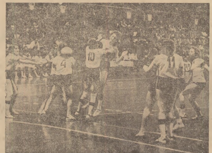
Fază din meciul Rulmentul Brașov — Constructorul Baia Mare. Moment de atac al echipei brașovene, rezolvat de apărarea echipei din Baia Mare.