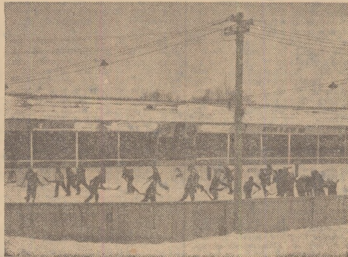
Fotograf amator din Mădăraș, Marton Miklos, a surprins această imagine de la primele antrenamente de hochei desfășurate pe noul patinoar din sat