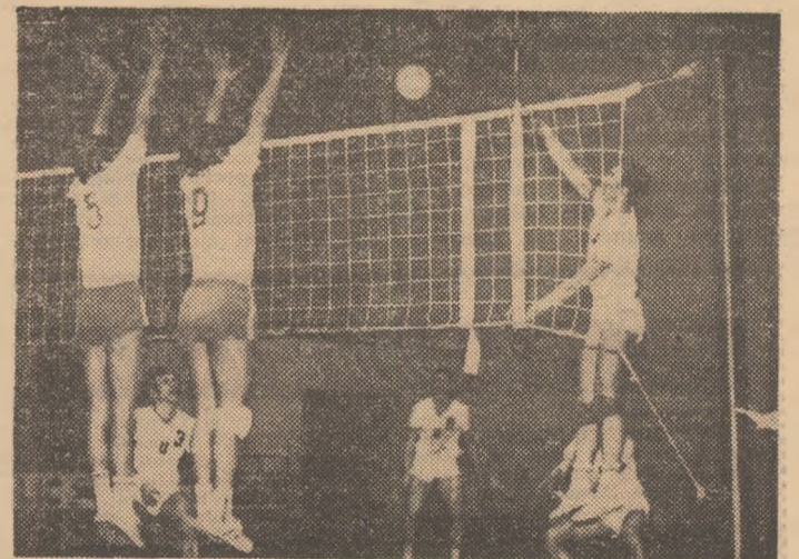
Fază dintr-un recent meci susținut de studenții de la „U”, în compania colegilor lor de la I.E.F.S., în Sala sporturilor din Cluj-Napoca, unde începe azi primul turneu masculin din cadrul noii ediții a Diviziei A.

maș. Este de reținut, de asemenea, ca o noutate față de ediția precedentă, faptul că echipele pornesc întrecerea pe grupe valorice cu întreaga „zestre” acumulată în cele 11 etape ale primei faze