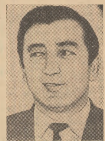
formații ale seriei în care activează?

— Dacă am reținut bine, Gloria poate fi cotată ca una dintre cele mai disciplinate