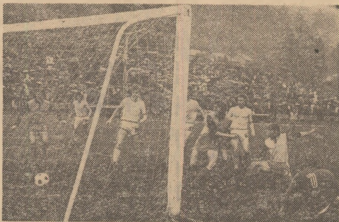
Tribunele pline pe stadionul din Valea Domanului la un meci disputat de formația favorită (în toamnă, cu F.C. Olimpia Satu Mare) pe un timp neprielnic, ploios. Suporterii lui F.C.M. Reșița de-abia așteaptă deschiderea sezonului fotbalistic.