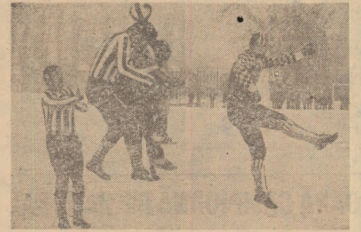
Unu din numeroasele atacuri la poarta formației Autobuzul (Fază din meciul Sportul studentesc — Autobuzul 2-2)

PROGRESUL BUCUREȘTI—METALUL BUCUREȘTI 1-0 (0-0). În cluda unui ger pătrunzător, care te îndemna să stai mai mult la gura sobei decît să mergi la fotbal, citeva sute de spectatori au ținut să asiste, ieri dimineață, pe stadionul din str. dr. Stavroviț, la amicalul dintre formațiile divizionare B bucureștene, Progresul și Metalul. Victoriile au revenit, la limită, bancarilor cu 1-0 (0-0), prin punctul înscris de D. Ștefan (min. 75 — din penalty). Cîteva remarcări: Dumitriu H, D. Ștefan, Iatan (un tânăr talentat provenit de la Flacăra Roșie), I. Sandu și Tevi (Progresul), Iordan, Nedelcu, Iancu, Omer și Sebe (Metalul) (Aurel PĂPĂDIE).