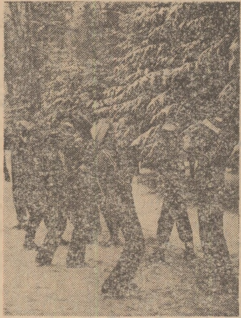
Moment al antrenamentelor jucătorilor arădeni la Moneasa: exerciții cu haltere mici