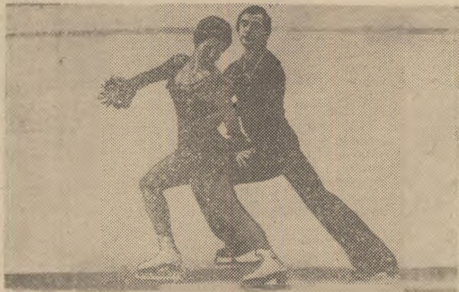
Favoriții probei de dans, în întrecerile de patinaj artistic: Ludmila Pahomova — Aleksandr Gorșkov (U.R.S.S.).

● Kruglov (U.R.S.S.) la 20 km biatlon și Sheila Young (S.U.A.) la patinaj viteză 500 m — campionii zilei ● Comportare modestă a biatloniștilor și boberilor români