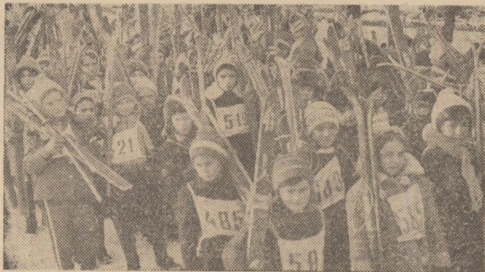
Printre numeroșii participanți la întrecerile de schi din cadrul „Festivalului sporturilor de iarnă” s-au aflat și elevii Școlii generale nr. 4 din Cimpulung Moldovenesc