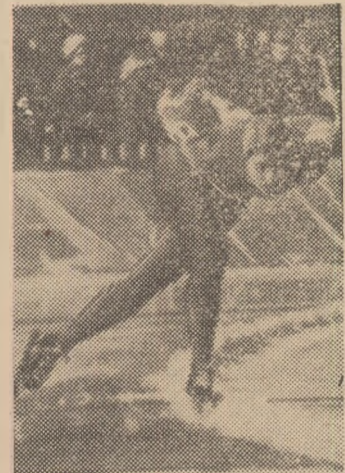
Sheila Young (S.U.A.), campioană olimpică la 500 m

ciologie). Noua campioană a deținut recordul mondial al probei; în 1975 a cucerit medalia de aur la poliathlon, iar în 1973 a cîștigat campionatul mondial de viteză la... ciclism! Vineri, la Olympia-Stadion ea și-a dominat net partenerule de concurs (36 de sutimi față de a doua clasată). De notat