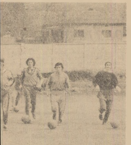
decadă a lunii trecute. Pe stadionul (echipă din seria a treia a Diviziei B) antrenament cu minca