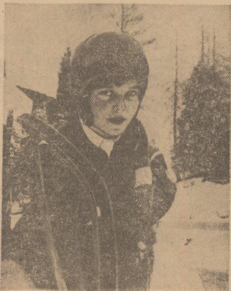
Margit Schumann (R. D. Germană) a devenit sîmbătă campioană olimpică la proba de sîniute

Prin abandonul lui Klammer și căderea lui Hauser, Austria pierde șansele și la combinata