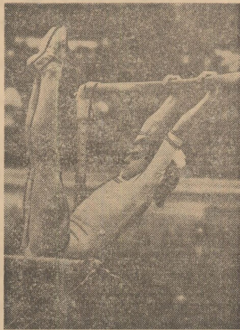
La paralele, Nadia Comăneci a fost notată de două ori cu 9,90 !

Debutul oficial al echipei noastre reprezentative în anul olimpic s-a soldat cu o victorie categorică re-purtată în fața selecționatei Angliei 383,20 — 367,50), dar nu succesul ca atare ne bucură cel mai mult, ci — cu deosebire — comportarea generală, cu totul remarcabilă a echipei române la începutul acestui deosebit de dificil an competițional, forma deosebită manifestată de toate cele șase componente ale formației alinate de antrenorii Bela Karoly și Nicolae Covaci. Așa cum era de așteptat, multipla campioană europeană Nadia Comăneci și-a onorat cu brio renumele, încintîndu-i atît pe spectatori cit și pe specialiști. La toate aparatele ea a prezentat exerciții de înaltă clasă, executate cu o virtuozitate și măiestrie care-i sînt proprii. Aproape că ne-am obișnuit acum ca cea mai bună gimnastă a țării noastre să fie răsplătită de cele mai exigente arbitre numai cu note de 9,80 și 9,90 ! Este evident, Nadia Comăneci își pregătește cu