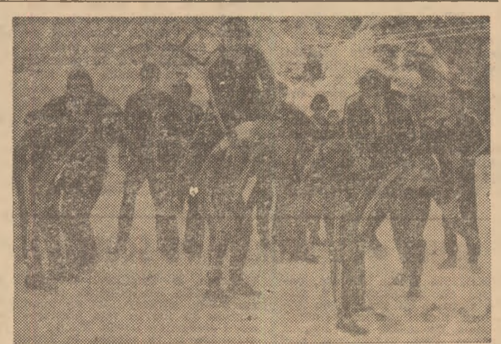
Jucătorii echipei F.C.M. Dușărea Giurgiu executînd un exercițiu specific dezvoltării mobilității și atenției.