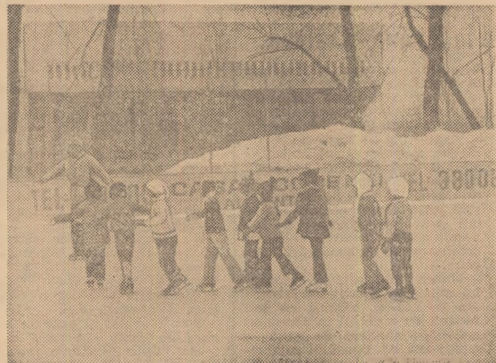
Bu-urii de tîrnă. Primii pași pe gheață ai prichindeilor de la grădinița nr. 28 sînt îndrumați de profesori cu experiență.