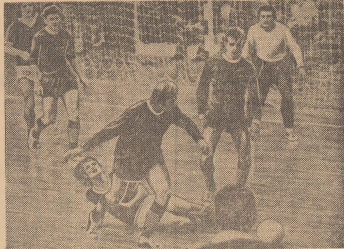
Fotbal „inaoară” la Budapesta... Pe teren redus se întinlesc echipele M.T.K. și Tatabanya.

De curind s-au împlinit 75 de ani de la înființarea federației maghiare de fotbal. Cu acest prilej a avut loc o ședință festivă. Au fost evocate succesele fotbalului din această țară, atit pe plan internațional, cit și în popularizarea sa în mase largi. S-a menționat, de pildă, faptul că selecționata Ungariei a susținut, în total, 495 meciuri, rezultatele cele mai bune datind din perioada de după eliberarea țării, cind din cele 254 de meciuri au fost câștigate 152 (față de 48 egale și 54 pierdute). Cele mai multe titluri naționale au fost obținute de echipele Ferencvaros (21) și