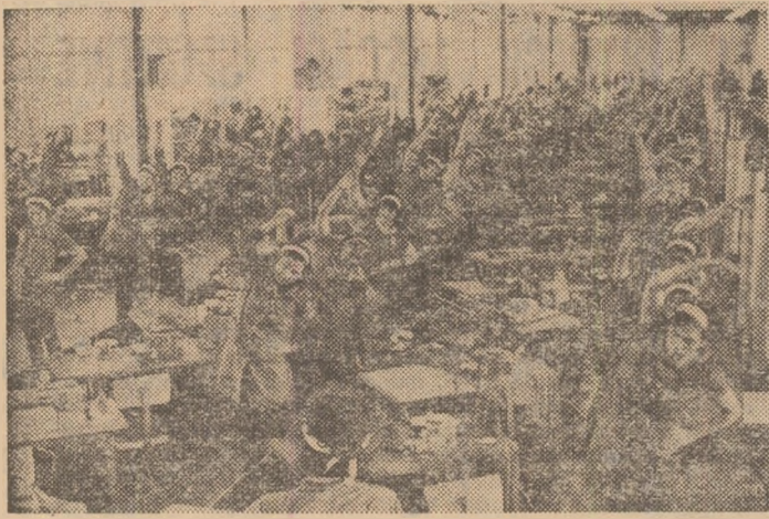
La întreprinderea de confecții și tricotație București, gimnastica la locul de muncă este practică permanent de colectivul secției 15, unde se realizează echipament sportiv.

În asociațiile sportive din întreprinderile și instituțiile Capitalei au loc, în aceste zile, numeroase acțiuni organizate în împlinirea Congresului U.G.S.R. În același timp se încheie bilanțul activității desfășurate anul trecut în activitatea sportivă de masă și în dezvoltarea bazei materiale. Citeva dintre aceste probleme au făcut obiectul unei scurte discuții purtate cu tov. Mihai Rusu, șeful Comisiei sport-turism la Consiliul municipal București al sindicatelor.