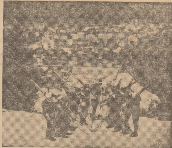
Pe pîrtia de la Dealul Negru, primii concurenți iau cunoștință cu locurile de întrecere. Foto: I. MINDRESCU — Succava