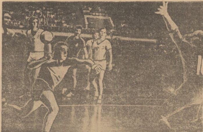
Fază din jocul România — R. D. Germană, disputat în ediția trecută a „Trofeului Carpați”

● Joi încep la Baia Mare intrecerile tradiționalei competiții internaționale ● Jocuri de mare atracție între cele trei fruntașe ale handbalului mondial: România, Iugoslavia și R. D. Germană.