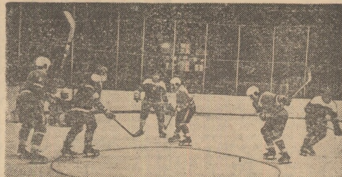
Pe noul patinoar artificial de la Ploiești, fază din meciul Austria—Iugoslavia