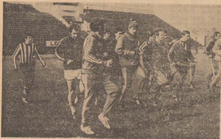
Rapid (stînga) și Sportul studențesc fac ultimele sprinturi înaintea întîlnirilor de mîine, cu Steaua și, respectiv, Dinamo.