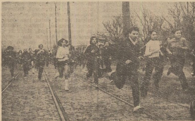
În Capitală, primele crosuri în cadrul ediției de vară a „Cupei tineretului“. Aspect de la întrecerea ce a avut loc pe bulevardul Expoziției