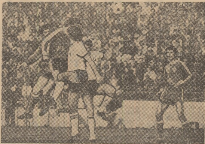
Un atac al echipei Steaua la poarta Universității Cluj-Napoca