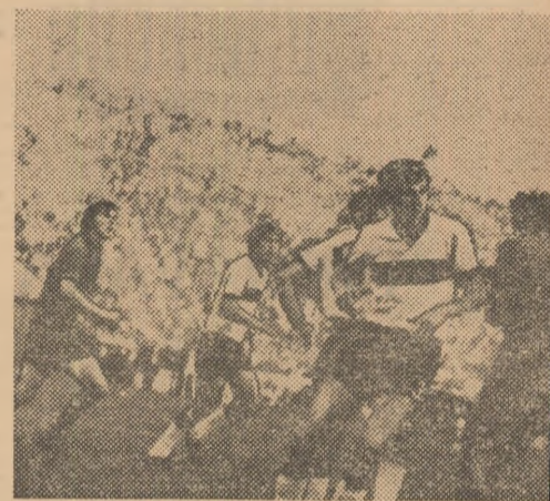
Secvență din filmul unei trecute partide Steaua. Emoții la poarta „alb-negrilor”.