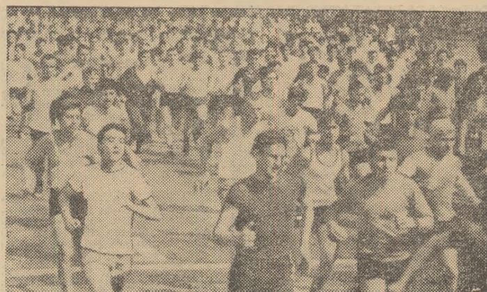
Încă o dovadă a dragostei pentru alergare în aer liber: instanțaneu de la o fază preliminară a „Crosului tineretului”

Organizatorii au completat programul finalelor cu o serie