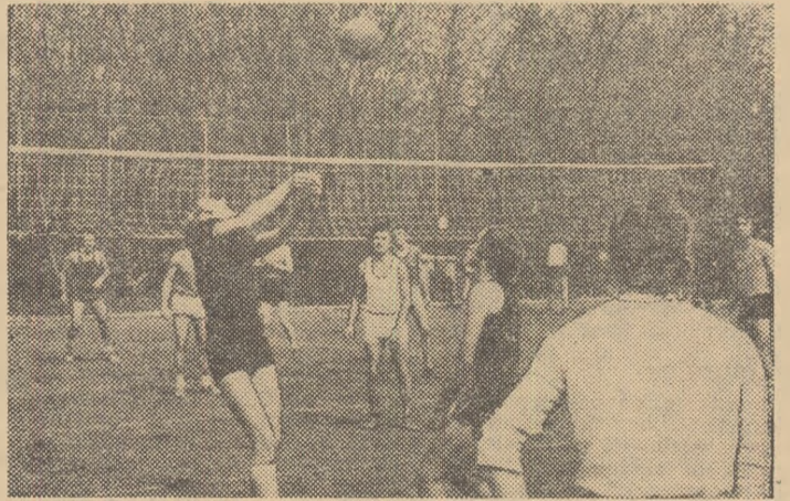
Terenurile de sport găzduiesc ample și viu disputate competiții omagiale

participare entuziastă la realizarea obiectivelor asumate de unitățile productive în cadrul planului general de dezvoltare economico-socială a țării, un nou prilej de intensificare a activității sportive de masă, a eforturilor în pregătirea sportivă în vederea obținerii unor rezultate de nivel superior în competițiile interne și internaționale ale acestui an olimpic.