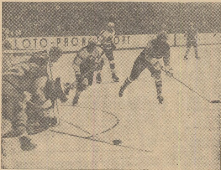
Imagine de la ultimul meci Steaua-Dinamo disputat la București. Atacă echipa Steaua, prin Miklos (19) talonat de Nuțescu (2) de la Dinamo.